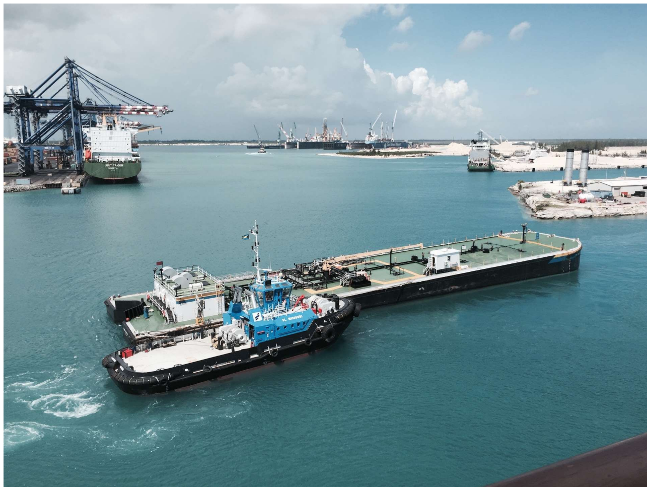
Foto de arquivo. Freeport Harbor com o terminal de contêineres ao fundo, em Freeport, Bahamas, 13 de maio de 2015. A Hutchinson Port Holdings, uma subsidiária da Hutchinson Whampoa, afiliada da República Popular da China, é proprietária e opera o porto de contêineres de Freeport, nas Bahamas.