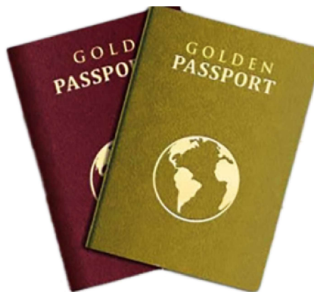
Bandeiras vermelhas entre passaportes dourados: Uma análise da influência chinesa em cinco programas de cidadania por investimento no Caribe