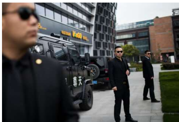
Empresas chinesas de segurança privada na América Latina